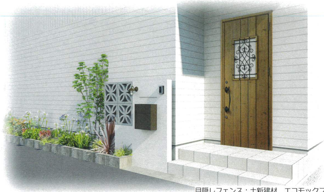
目隠しフェンス：土新建材 エコモックフェンスW4000×H1800 (板：グレージュ色 柱：ステンカラー色)